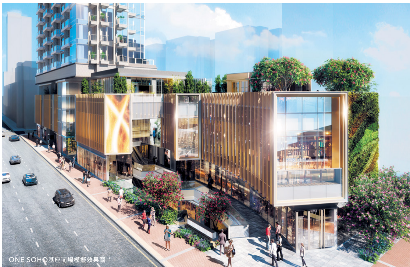
ONE SOHO 基座商場模擬效果圖 13