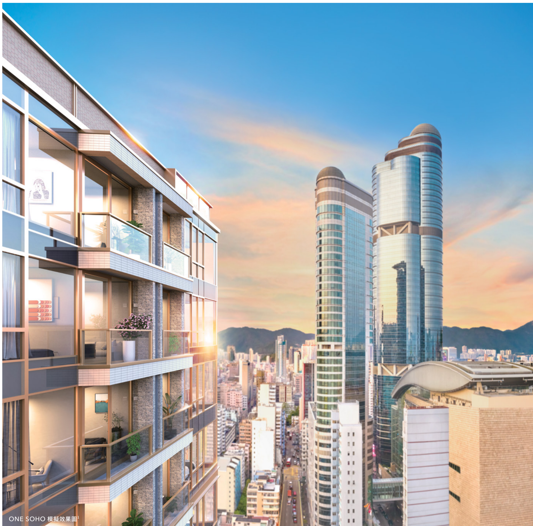
ONE SOHO 模擬效果圖 1